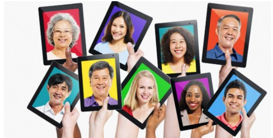
Tolk (spreekbuis cliënten)