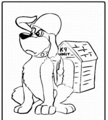
Waakhond (rechten cliënten)